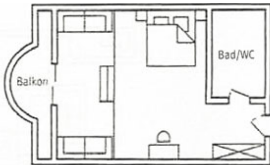
Zimmerbeispiel Family Comfort

LAGE: Direkt am Meer an zwei Buchten mit hoteleigenen Sandstränden gelegen, ca. 1,5km von Özdere mit mehreren Einkaufs- und Unterhaltungsmöglichkeiten, ca. 35km. von Kusadasi und ca. 55km vom Flughafen Izmir entfernt. EINRICHTUNGEN: Nationale Kategorie: